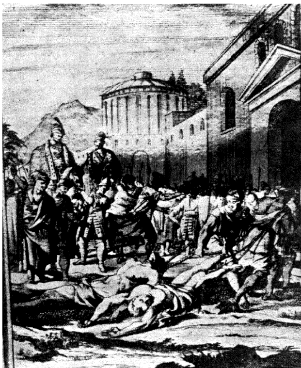
THE MURDER SCENE (From Havart)