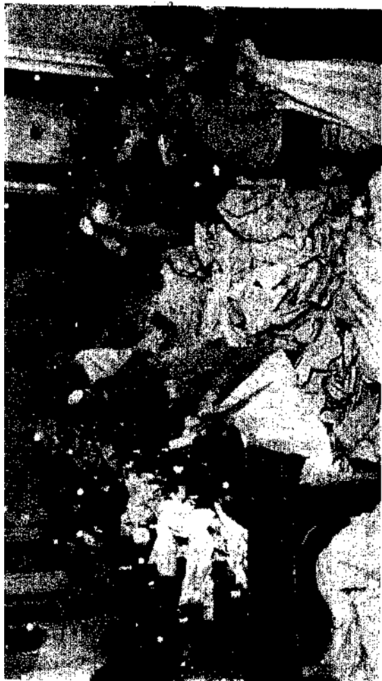
Atelier de couture d'un prophylactorium