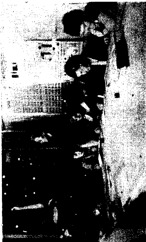
Groupe d'hospitalisées thériées d'un prophylactorium aux études