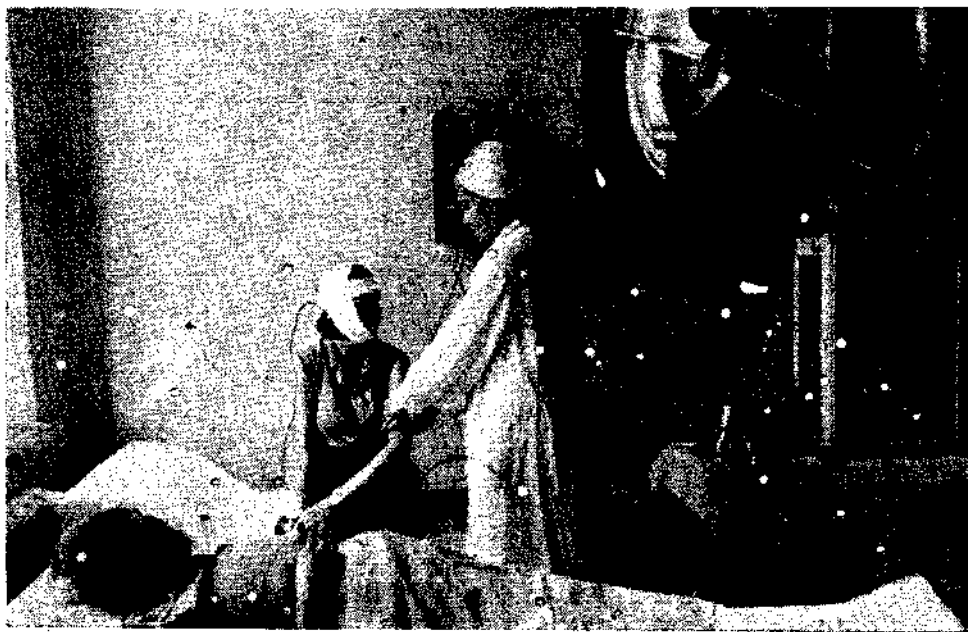
Au cat Au cabinet de traitement médical d'un Prophylactorium de travail