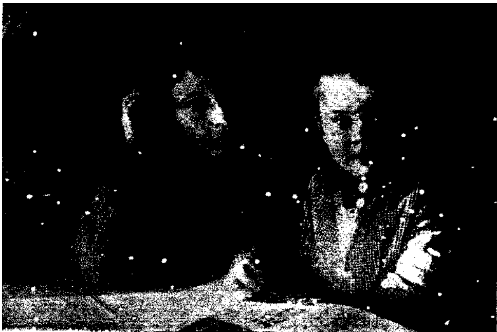
Aucienne hospitalisee d'un prophylactoriund, directrice d'un réfectoir avec son enfan bien poram'au,