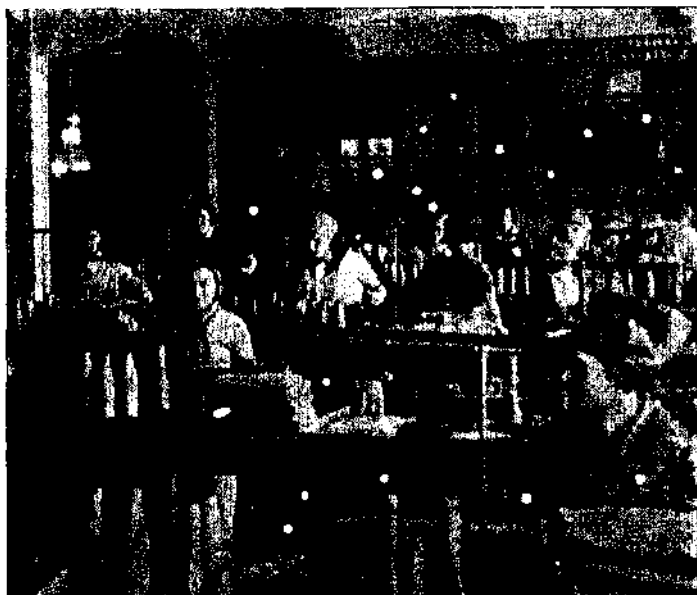
Atelier de tricotage d'un I