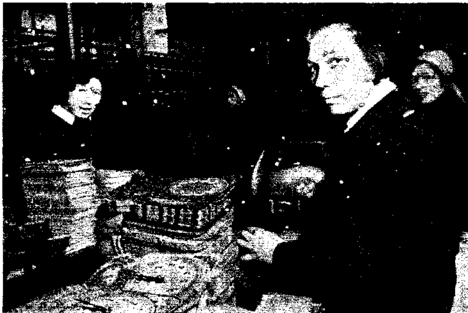
Ancienne hospitalisée de prophylactorium, ouvrière d'un atelier de montage dans une fabriqué d'horlogerie à Moscou