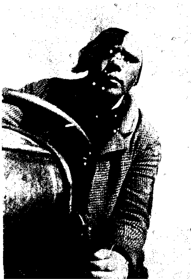
Chauffeur de tracteur, ancienne hospitalisée au prophylactorium