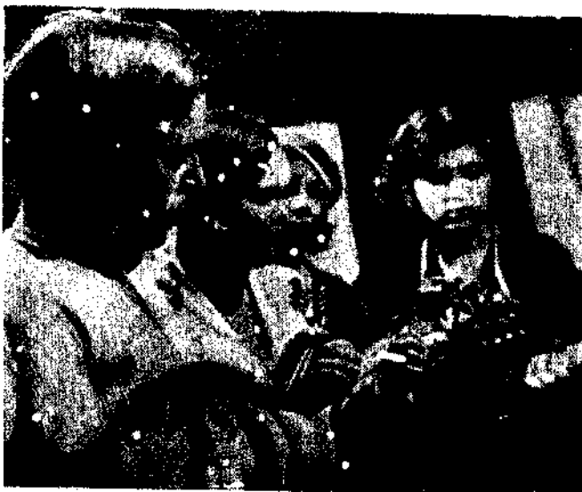
Cercle musical autodidacte d'un Prophylactarium