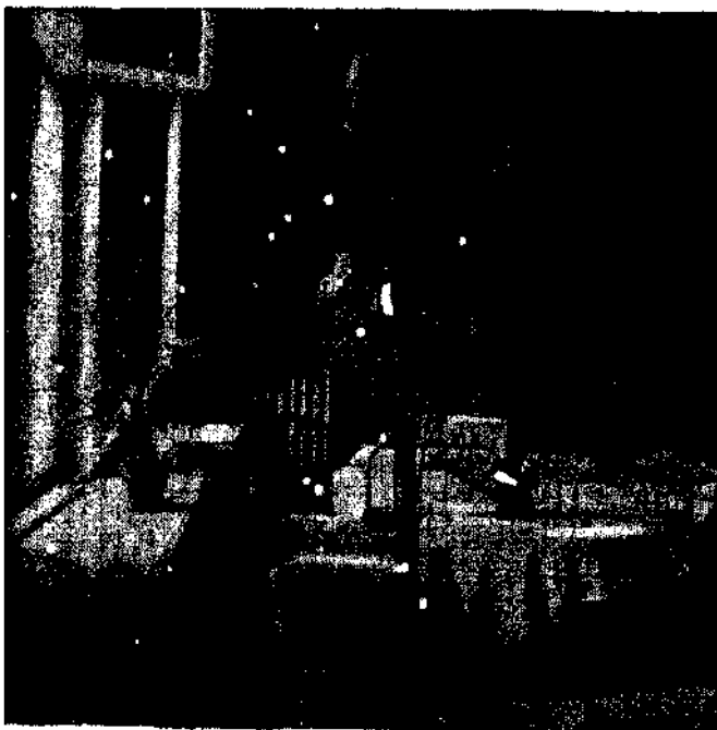
Chambre it' habitation commune d'un prophylactorium