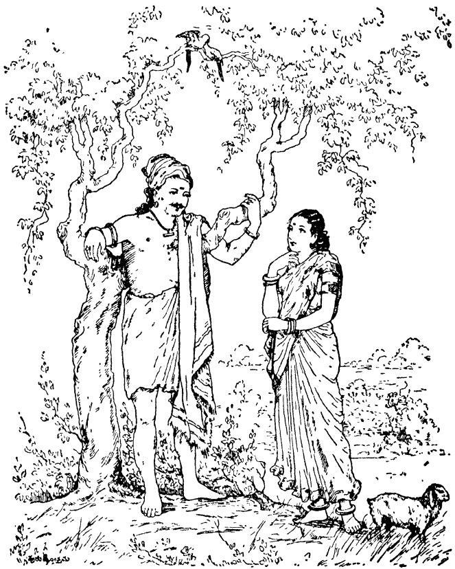
ತನಬೇಕು, ಗುಣವಿಲ್ಲ ಇದನು ಬಿಟ್ಟು