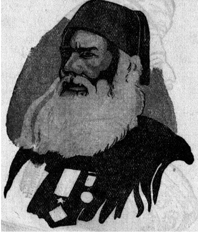
सर सैयद अहमद