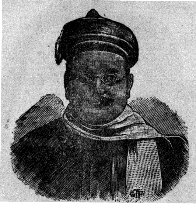
गोपाल कृष्ण गोखले