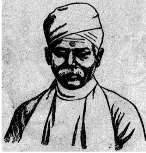
पंडित मदनमोहन मालवीय