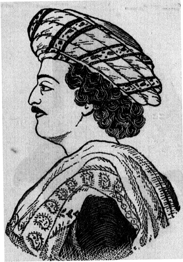
राजा राममोहन राय