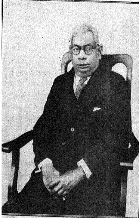
सर सी० वाई० चिंतामणि