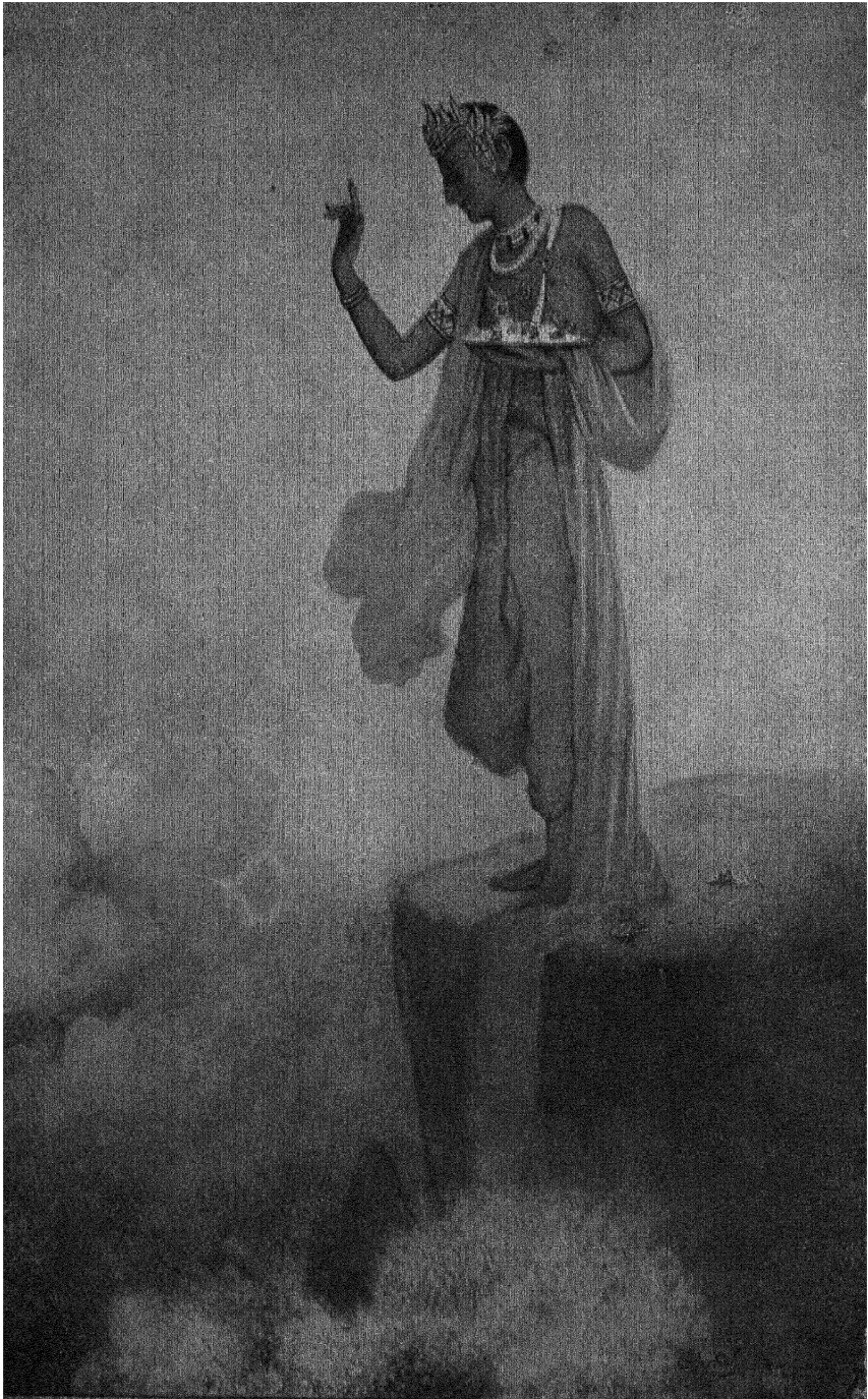
विरही यत्न ।