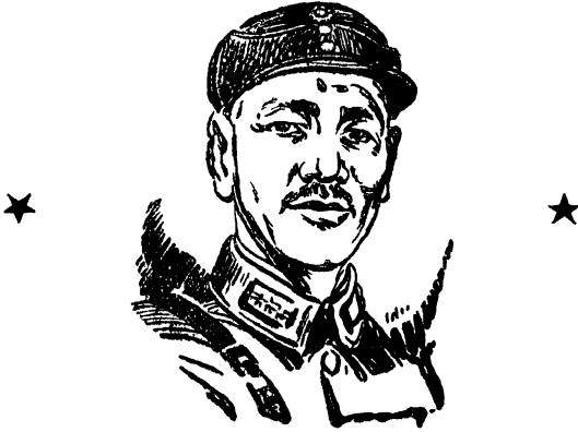
जनरल चिआङ कायी शेक