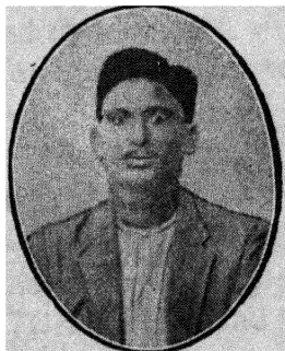
కొ. వెం. సు