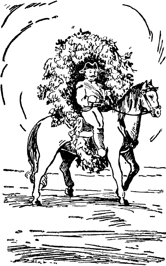
ಕುದುರೆಯ ಚೆನ್ನಿನ ಮೇಲೆ ಬಳ್ಳಿಯ ಮನೆ

ಕೆಲವು ಮೂಲಿಕೆಗಳನ್ನು ಇಟ್ಟು ಬಲವಾಗಿ ಕಟ್ಟಿದೆ. ಒಂದೆರಡು ವಾರಗಳಲ್ಲಿ ಎರಡು ಅರ್ಧಗಳೂ ಕೂಡಿಕೊಂಡವು. ಗಾಯ ವಾಸಿಯಾಯಿತು. ಅಷ್ಟೇ ಅಲ್ಲ. ಸಂಧಿಸಿದ ಕಡೆಯಲ್ಲಿ ಕಟ್ಟಿದ್ದ ಮೂಲಿಕೆ