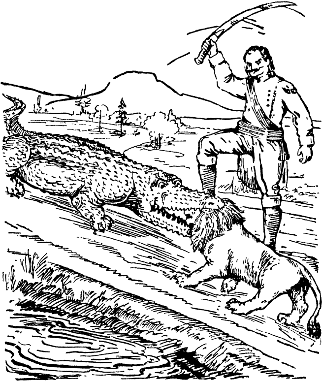
ಆಗ ಕತ್ತಿಯನ್ನು ಮೇಲೆತ್ತಿದೆ

ಏನು ಮಾಡಲಿ? ಹಿಂದೆ ಸಿಂಹ! ಮುಂದೆ ಮೊಸಳೆ! ಬಲಗಡೆ ಆಳವಾದ ಕೊಳ! ಎಡಗಡೆ ನೋಡಿದರೆ, ಅಡಿಯೇ ಕಾಣದಷ್ಟು ಆಳವಾದ ಕಮರಿ! ಪ್ರಸಾತ! ಆಗ ಬೇರೆ ಏನು ಮಾಡುವುದಕ್ಕೂ ತೋಚದೆ, 'ದೇವರೇ ಗತಿ!' ಎಂದುಕೊಂಡು, ದೊಪ್ಪನೆ ನೆಲದ ಮೇಲೆ ಮುಖ ಅಡಿಯಾಗಿ ಬಿದ್ದುಕೊಂಡುಬಿಟ್ಟೆ.