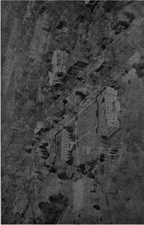
தஸ்கு஑ீச் சர்வகலாசாலை ஆகாயத்தோற்றம்