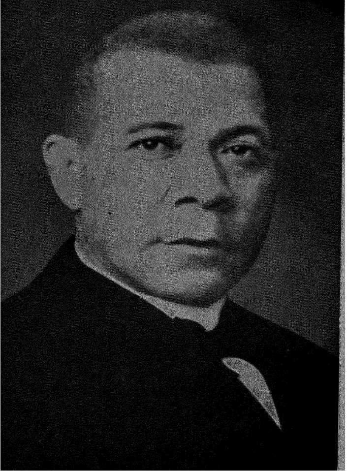
புக்கர் தி. வாஷிங்குடன் இளமைத் தோற்றம்