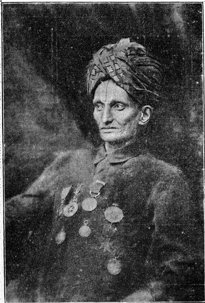
Bellary. D. KRISHNAMA CHARLU, ANDHRA NATAKA PITHAMAHA, Born 1853 -Died 1912.