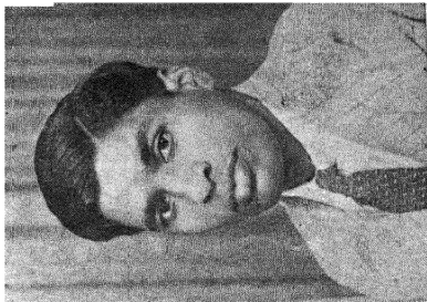
வித்துவான் வி. அ. அரங்கசாமி