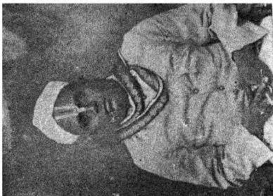
வித்துவான் ஆ. முவராகம் பிள்ளை