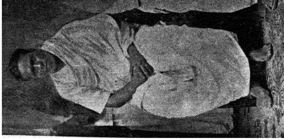
வித்துவான் டி.பா. மீனாட்சிசுந்தரம் பிள்ளை