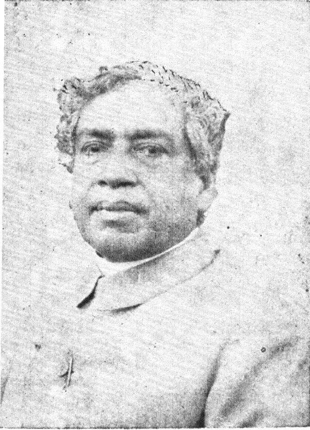
ಸರ್ ಜಗದೀಶ ಚಂದ್ರ ಬೋಸ