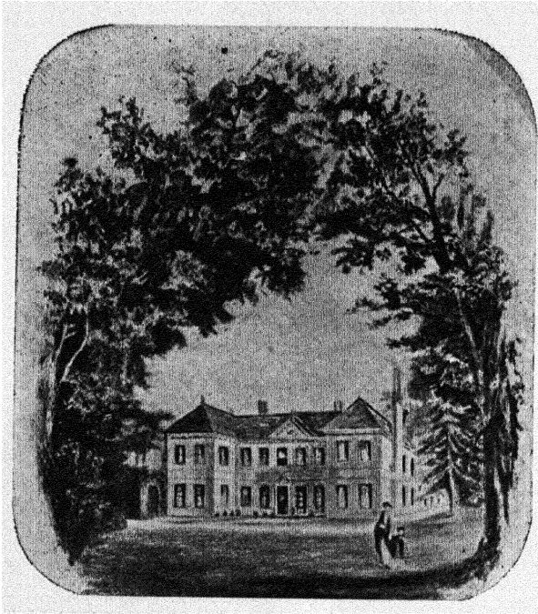
फोर्डप्लेस-शेडो का जन्मस्थान