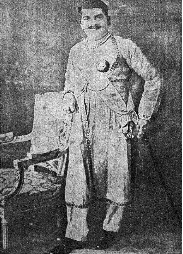
श्रीमान् महाराजा सर सयाजीराव गायकवाड्,