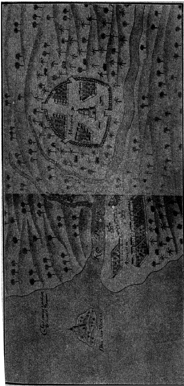
मनोरचा किछा अगाशी व अर्नाळा ह्यांचे दृश्य. ( जुन्या पोर्तुगोज चित्रावरून. )