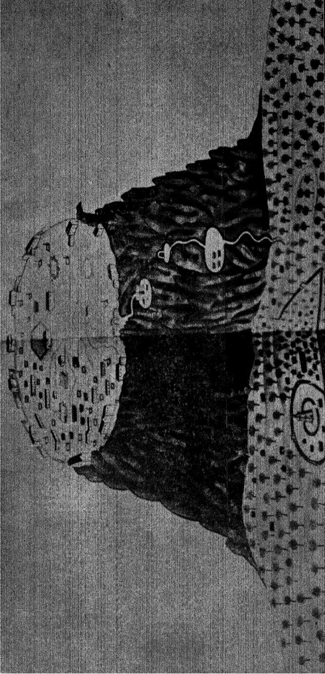
अशेरीत्वा किह्या. ( जुन्या पोरुंगज वित्रावरुन. )