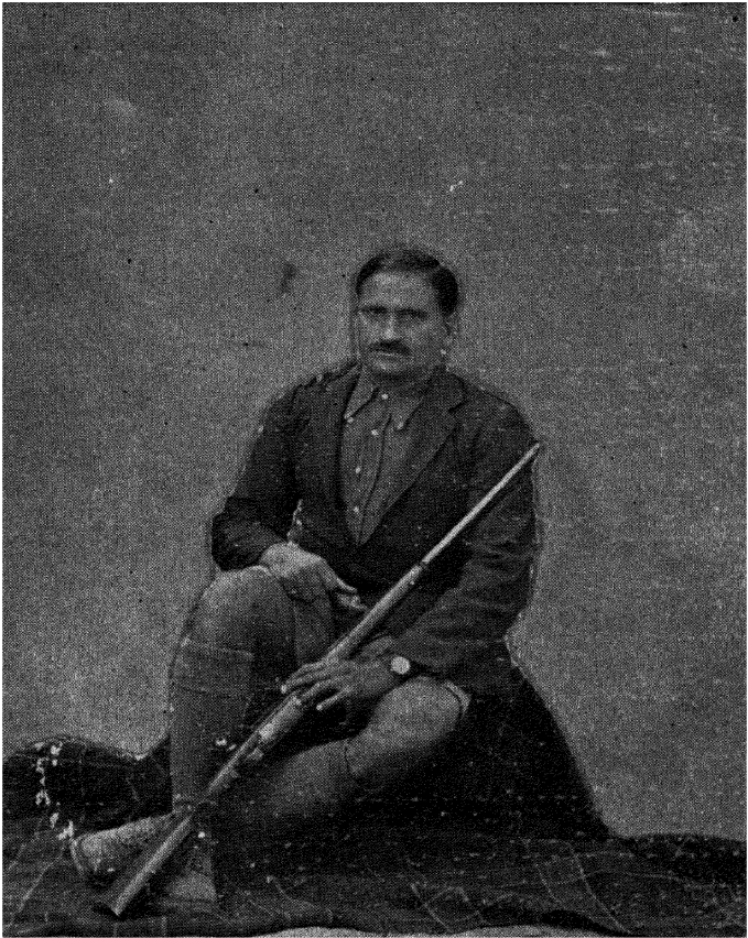
लेखक सन् १९२६ में