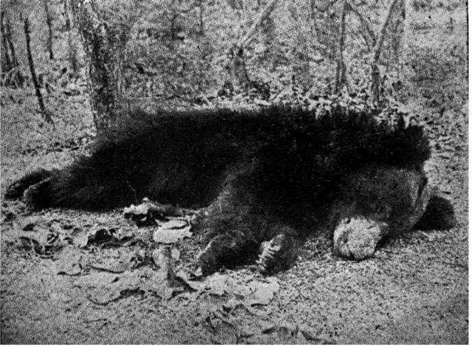
रीछ ( भालू )