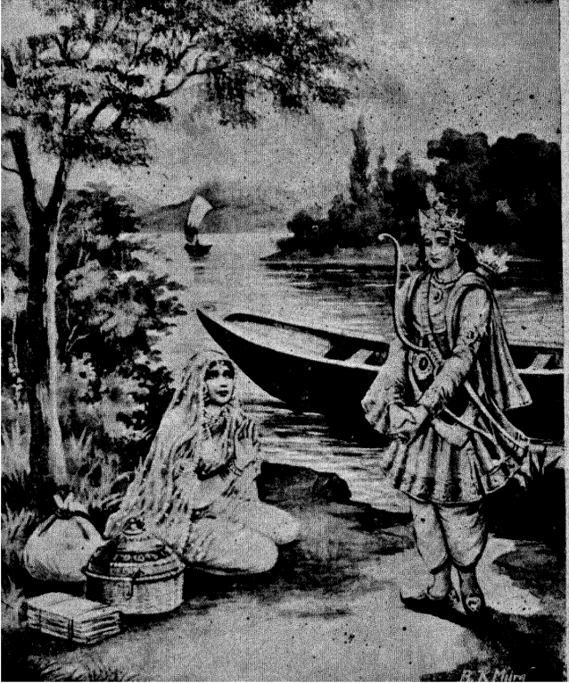
ಸೀತಾ ವನವಾಸ—ದೂಃಖೀ ಸೌಮಿತ್ರಿ.