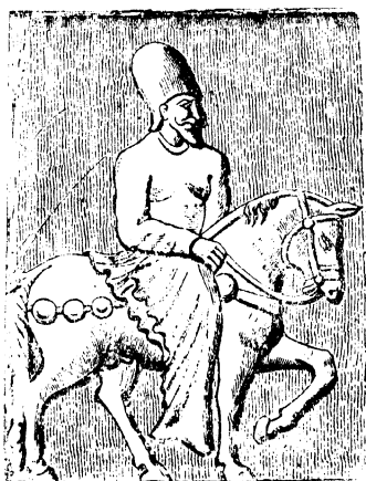
لیک نفر از سواران زره پوش ساسانیان .

( خنجر را بزمین میگذارد و خود را بر آن می اندازد ) شاهنشاهها - جانا - یارا بنگر - بنگر چونان شیرینت بتو می پیونده . . . . .