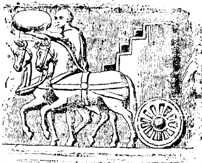
گردونه ساسانی .

ذبیح بهروز ابن ابوالفضل الطیب الساجی ۲ ماه اسفندار ۱۳۰۶