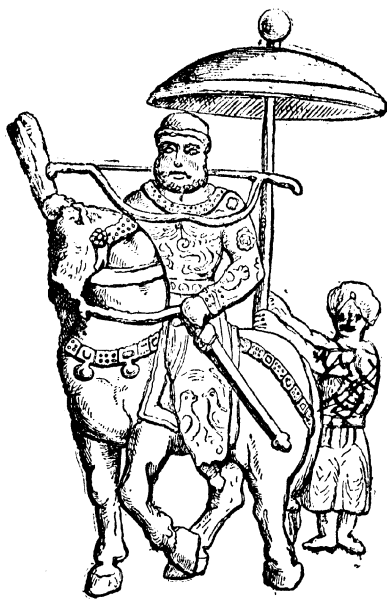
خسرو پرویز و شبدیز .