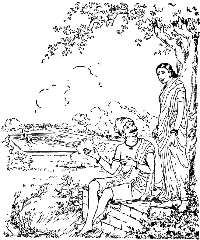
ಆದನು ಮಲ್ಲಿಯ ಕೋಶು ಎಂದ ಎಳಸ