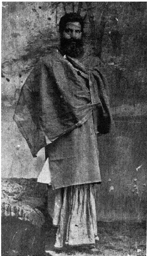
महात्मा मुन्शीराम जी ( स्वामी श्रद्धानन्दजी )