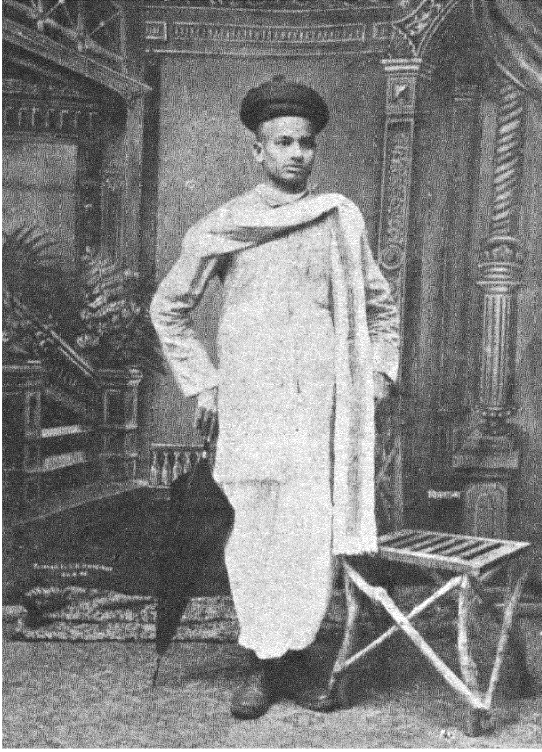
श्रीयुत न. चिं. केळकर, १८९८