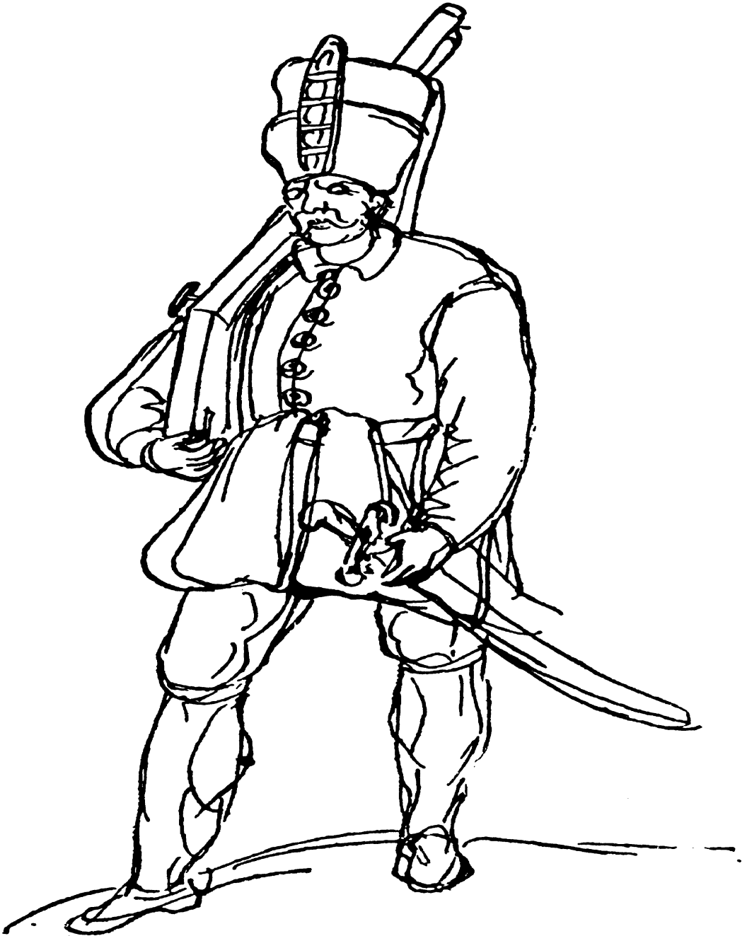
قصو پريك سر باز يني چرى در قرن يازدهم هجرى قمرى