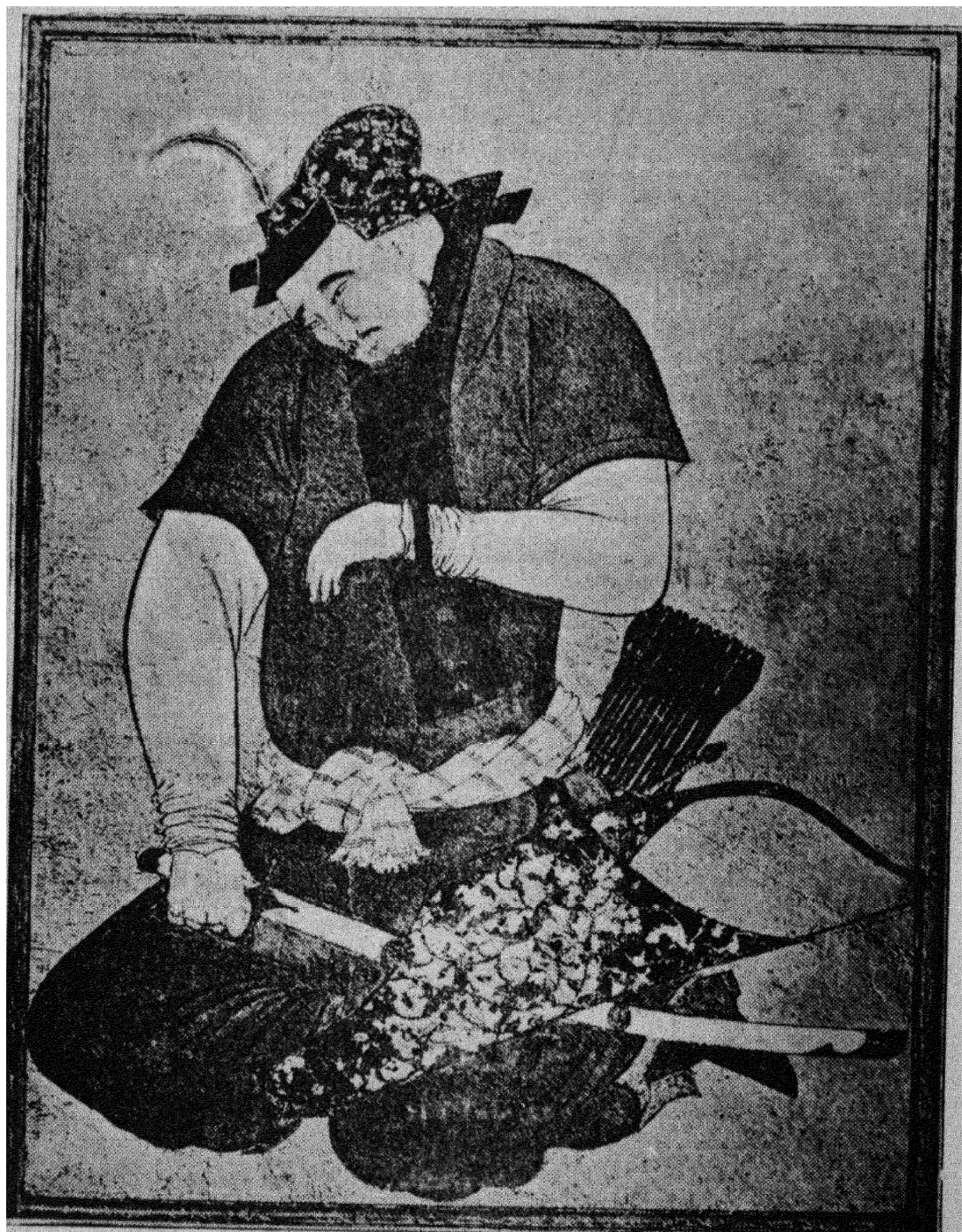
تصویر مراد بیگ آق قویونلو از قرن دهم هجری