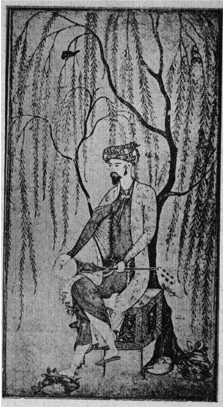
تصویر پسر سلطان سلیم خان کار آقارضای نقاش، در قرن دهم هجری