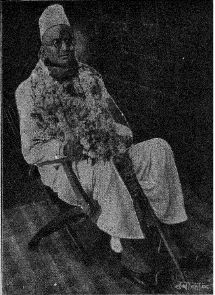
दुखण्यांनी आणि हारांनीं भारावलेले , बेळगांव साहित्य संमेलनाचे अध्यक्ष-शिवरामपंत परांजपे.