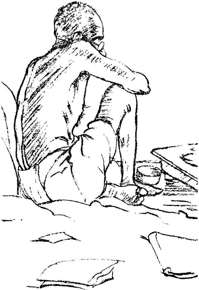
ಕೇವಲ ಬಿತ್ತ - ಉಳಿ ಕೆಲಸ ಎರಡೂ ( ೨೪ ಭೂರಸಿಕೆ ವಿವರ )