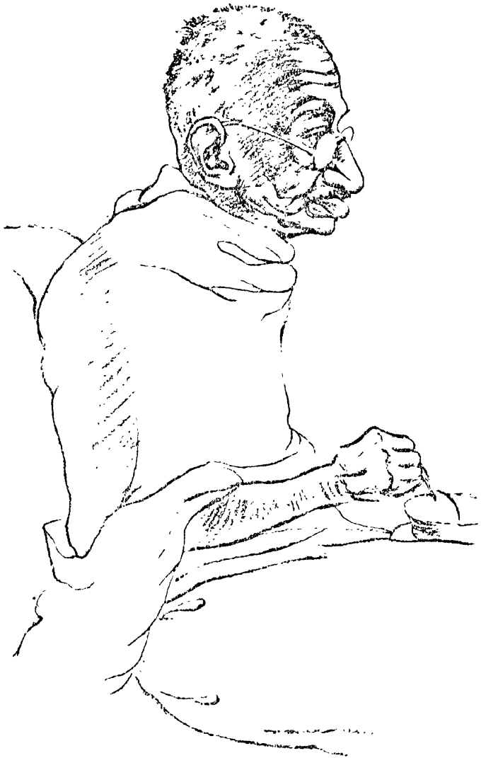
ಶಿಲ್ಪಕಲೆ - ಉಪ ಕೆಲಸ ನಡವಣಿ ( ಡಾ. ಭಾರವೀಶ್ವರ ಪಿಳವೆ )