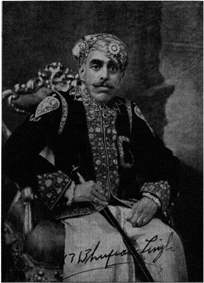
हिन्दू-कुल-शिरोनधि महाराणा भूपालसिंहजी, महाराज-प्रमुख, राजस्थान