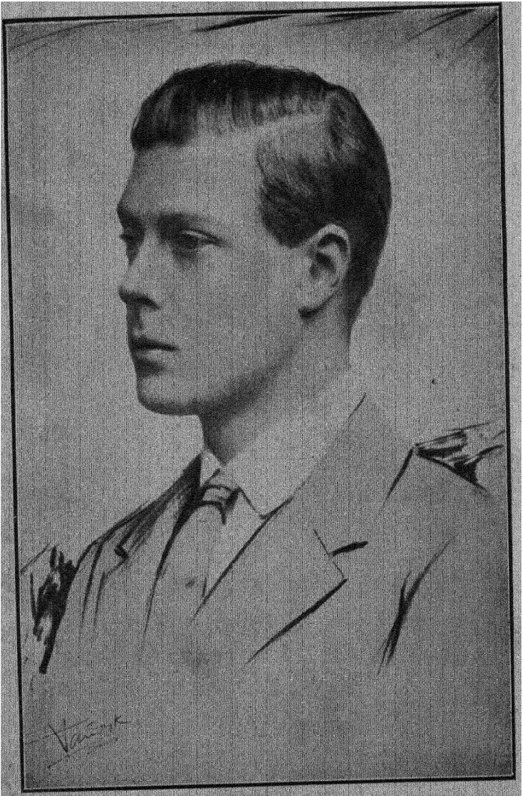
बादशाहा आठवे एडवर्ड