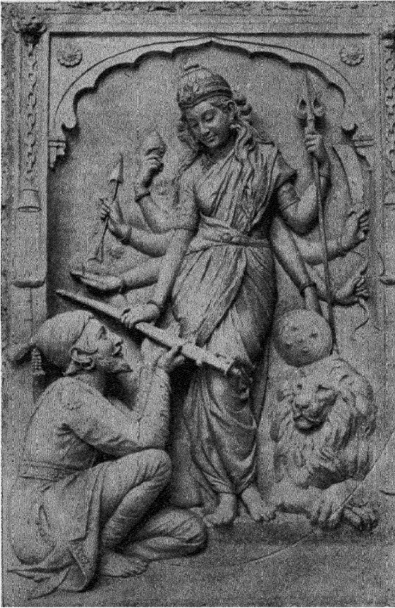
शिवाजी और भवानी ( कऱमरकरकी बनाई हुई मूर्ति )