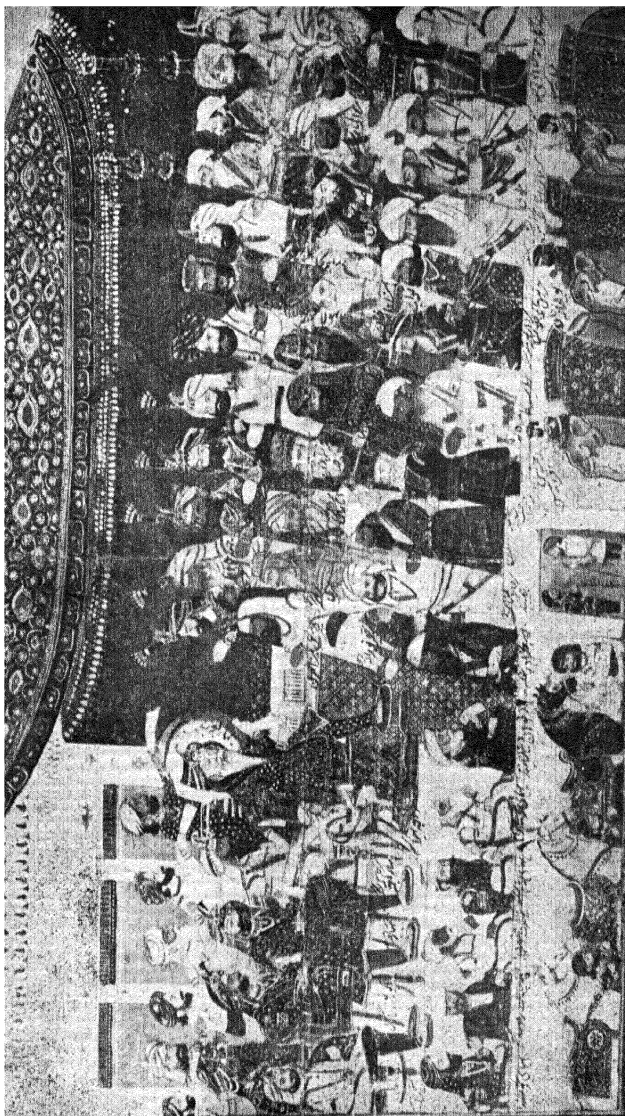
महाराजा रंजीतसिंह का दरबार