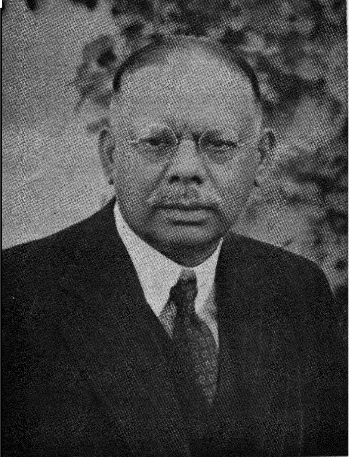
آفریدی سرسیدی سلطان احمدی کے 'سی' ایس 'آئی' - قی . ایل - ہارایت لا ممبر انڈیا مہشن ایلڈ ہرآڈ کاسٹنگ