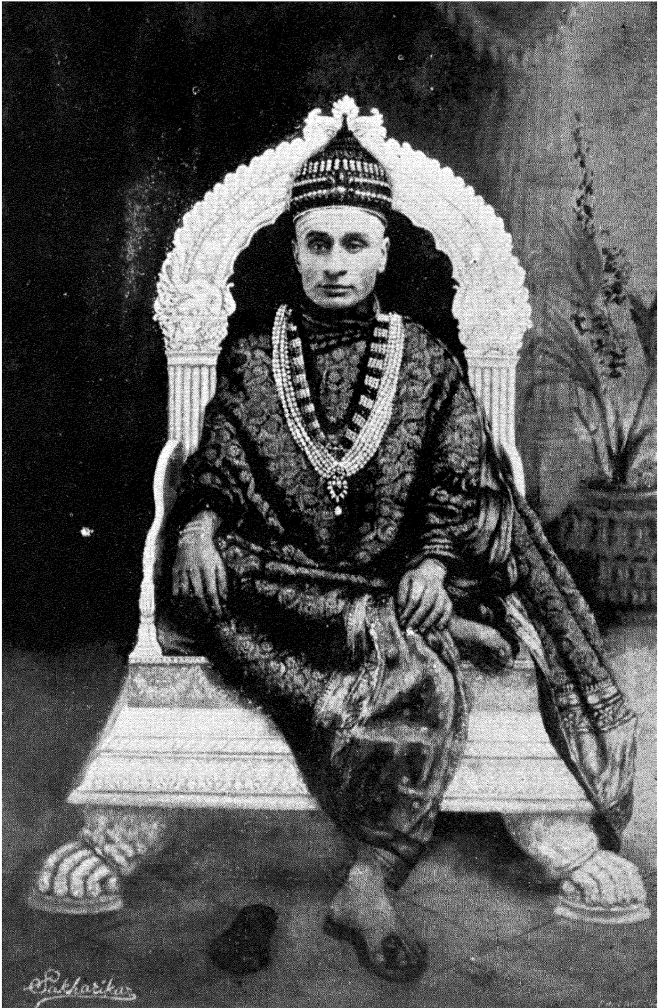
ಶ್ರೀಮತ್ಪರಮಹಂಸಸರಿವ್ರಾಜಕಾಚಾರ್ಯೇತ್ಯಾದಿಬಿರುದಾಂಕಿತ ಶ್ರೀಮತ್ಪರಸೀರ ಸಿಂಹಾಸನಾಧೀಶ್ವರ ಶ್ರೀಜಗದ್ಗುರು ಶಂಕರಾಚಾರ್ಯ ಶ್ರೀನಿವ್ಯಾಶಂಕರಭಾರತೀಸ್ವಾಮಿಗಳು.